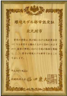
環境モデル都市認定証

低炭素社会の実現に向けて先駆的に取り組もうとする自治体を、政府が財政支援する「環境モデル都市」に7月22日、北九州市が選ばれました。全国82件の提案の中から、下記6団体が「環境モデル都市」として認定されました。