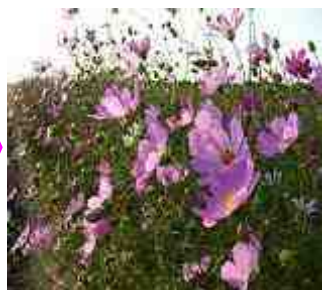
9月下旬~10月中旬頃が見ごろです