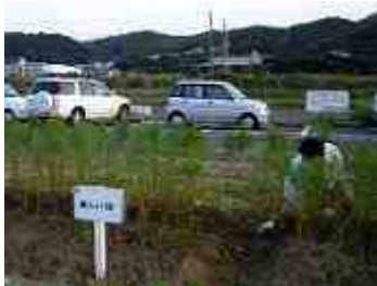
8月31日撮影、草取りも終え、只今順調に育っています。

楽しい(株)も7月4日に約30㎡を受け持ち、皆さんで種まきをしました。7月下旬の豪雨にも耐え8月末には約50cmまで成長しました。