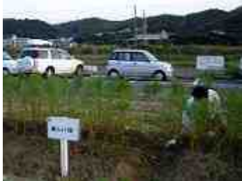
8月31日撮影、草取りも終え、只今順調に育っています。

楽しい(株)も7月4日に約30㎡を受け持ち、皆さんで種まきをしました。7月下旬の豪雨にも耐え8月末には約50cmまで成長しました。