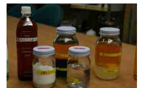
バイオディーゼル燃料

その他、詳しい内容を、現時点でお伝えすることは出来ませんが、半年以内ほどで、農林水産省 バイオマス・ニッポンのホームページに、滋賀県多賀町のバイオスタウン構想書が公表される予定です。