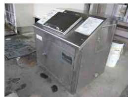
多賀小学校の生ごみ処理機

ことを決定され、今年度中を目標に、バイオスタウン構想を公表予定で進行されています。