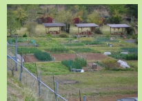
おいでな菜園(唐津市七山滝川)