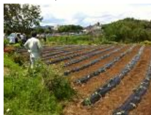
YUGI MURA farm 1,000㎡