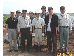
NPO 法人工房はづき 300㎡