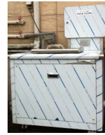
松戸五香クラブの装置

松戸五香クラブに設置した生ごみ処理機は、生ごみの保管が不要のため、カラスの被害が無くなって近隣の方にも好評です。