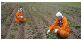
除草作業 平成 24 年 5 月 26 日

1 月 24 日に豊年祈願祭が行われ、シダックス志太社長が「鍬入れ」を行いました。