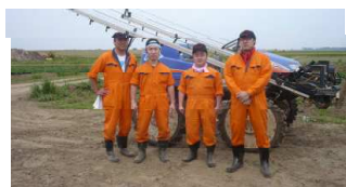
シダックスファーマーズの皆さん

シダックスエコファーム(千葉県柏市)で、シダックスファーマーズが、じゃがいも畑や里芋畑の除草作業をしています。