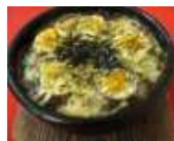
チーズ焼きカレー