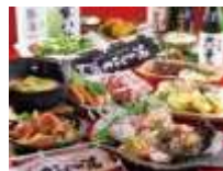
飲み放題付コース 5,000 円(全 13 品)