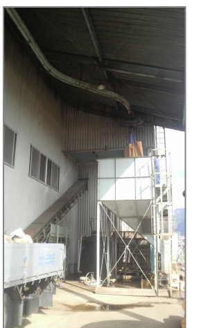
明石酒造へ無事納品 (宮崎県えびの市)