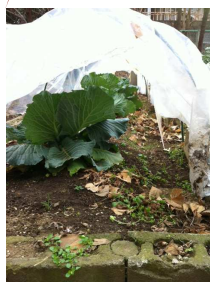
(第四中学校のキャベツ)

松飛台第二小学校、牧野原中学校では、堆肥を花壇に使い、パンジーやピオラを咲かせています。第四中学校では、校舎の中庭の畑で、特別学級の生徒さんが、大根、ブロッコリー等を栽培しています。写真は、現在栽培中のキャベツです。