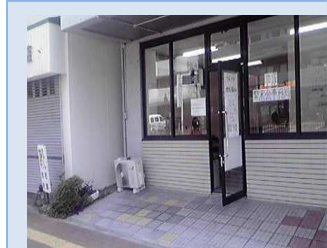
京塚生き生きカフェ 平成22年7/17(土)オープン

生ごみ持込み量：3284Kg 〃持込み延べ人数：882名 一回当たりの生ごみ量：3.7Kg 減CO2量：105.7Kg