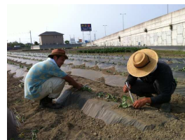
小暮農場(埼玉県本庄市)