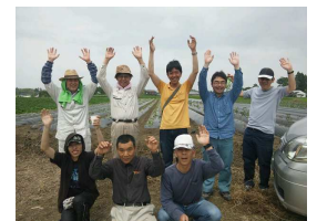
NPO法人工房はづき(宮崎県宮崎市) 障がい者就労支援事業所