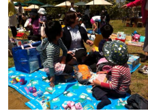
キッズチャリティ フリマ