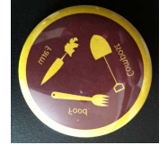
食品リサイクルの 特製缶バッジ