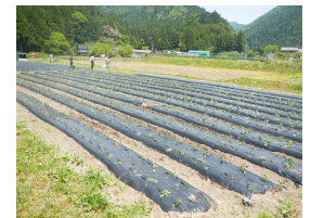
七彩の風(京都市左京区) 障がい福祉サービス事業所