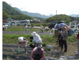
あざみ園(福岡県北九州市) 障がい者福祉サービス事業所