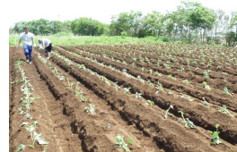
認定NPO法人いもむし(千葉県柏市) 障害者自立訓練事業所

上記システムを有機的に組み合わせて開発した新資源化システム(堆肥化・油化・炭化)システムを提供し、今後、焼却炉を持たない自治体等への導入を目指します。