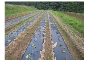
弘川農園(山口県下関市)

ハチドリ通心は楽しい株式会社のホームページでご覧いただけます。 URL: www.fun-c.jp/ をご覧ください。(竹村・竹下が担当しました。)