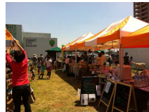
地元野菜の販売 (グリーンマルシェ)

オークビレッジ柏の葉様(千葉県柏市、食と農の複合施設)は、5月3~5日「食と農のつながりを学び、環境に優しい暮らしを楽しむ」をテーマにイベントを開催しました。その中で、子供たちに食品リサイクルの環境教育を行う企画として、「食品くずを持って行こう!」を行い、生ゴミを持ってきた子供たちには、食品リサイクルを描いた「特製缶バッジ」をプレゼントしました。またイベント期間中、(株)メリーズ・ジャパン(楽しい(株)のグループ会社)が、生ゴミ処理機を貸し出しました。