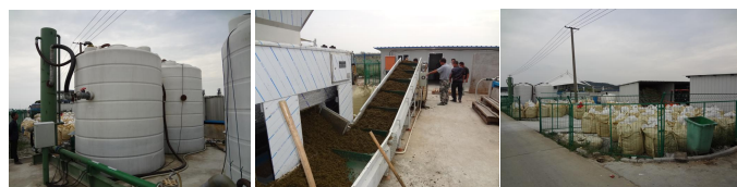
無錫市 アオコ一貫処理システム

回収したアオコをその場で速やかに発酵させ堆肥にしていく一貫処理システムで実証を行い、メリーズシステムが中国でも大いにお役に立てることが証明されました。今年、メリーズシステムの発酵技術を本格導入していくべく無錫市政府、現地企業と協議、準備中です。