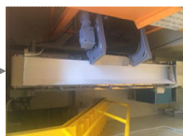
ベルトコンベア 1 (自動搬送) 舟底コンベアから粉碎机へ運搬