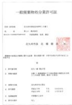
一般廃棄物処分業許可証