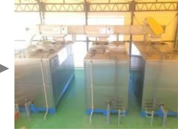
一次発酵装置 1.5t / 日 (3 台) 命名: エコロジーハチドリくん エコノミーハチドリくん 減 CO2 ハチドリくん