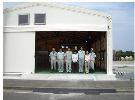
7 月 16 日より稼働開始！

ハチドリ通心は楽しい株式会社のホームページでご覧いただけます。 URL: www.fun-c.jp/ をご覧ください。(上村が担当しました。)