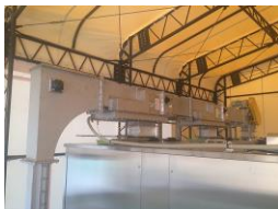
コンベア 2 (自動搬送) 脱水後の残渣を運搬