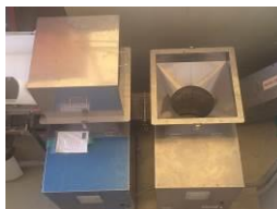
粉碎机 (2 台) 1 時間 1000 ℓ の野菜を粉碎