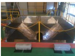
日量 4.5t の受入ピット ピットの下には舟底コンベア