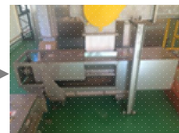
脱水機 スクリュウタイプの羽根で脱水