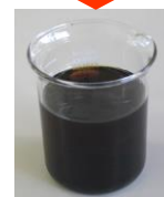
ナフサ、軽油相当の油