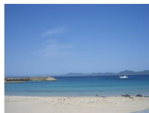
三井楽町、高崎漁港付近

実証事業を行う五島市三井楽町は福江島の北西に位置し平成 26 年 10 月 6 日、三井楽町の高崎鼻～柏崎～長崎鼻までの海岸域及び海域が、国の名勝として正式に指定されました！