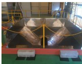
日量 4.5t の受入ピット