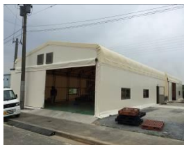
北九州エコタウン地域循環圏リサイクルセンター

自治体ごとに最適化した提案による「メリーズシステム」を導入することにより、ごみ廃棄量、CO 2 、処理コストの削減に効果があります。また、地域の農家とも連携でき官民一体となった地域循環圏構築を推進します。