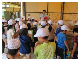
北九州エコタウン地域循環圏リサイクルセンターでの 社会科見学