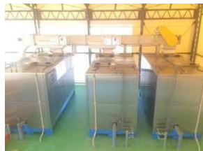
一次発酵装置 1.5t / 日 (3 台)