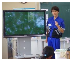
小学校 4 年生