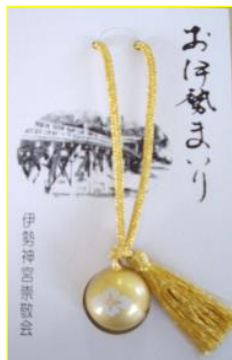
伊勢神宮 鈴 色はおまかせとなります。