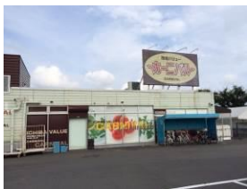
カーニバル本城店 生ごみ処理機 H18年11月設置