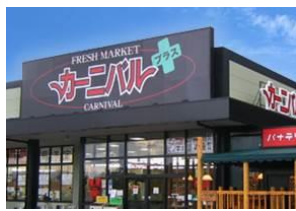
カーニバルプラスひびきの店 生ごみ処理機 H19年3月設置