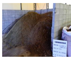
2次・3次発酵エリア