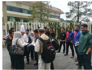
(下)現地ホテル・農家への調査