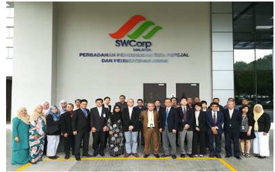
(上)キックオフミーティング後の集合写真

2018年5月現在、順調に調査が進んでいますが、調査中のため調査風景を写真でご紹介します。